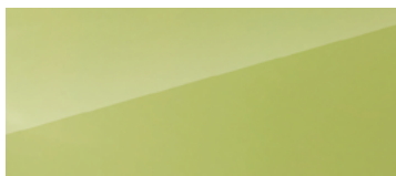
Lime zelená (nemetická)