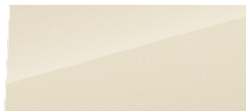
Apricity biela (metalická)