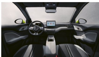
Čierna a sivá