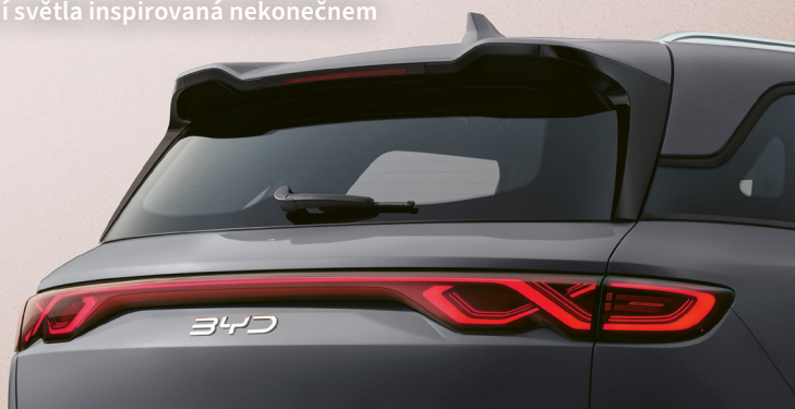
Zadní světla inspirovaná nekonečnem