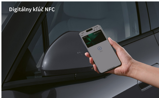
Digitálny kľúč NFC